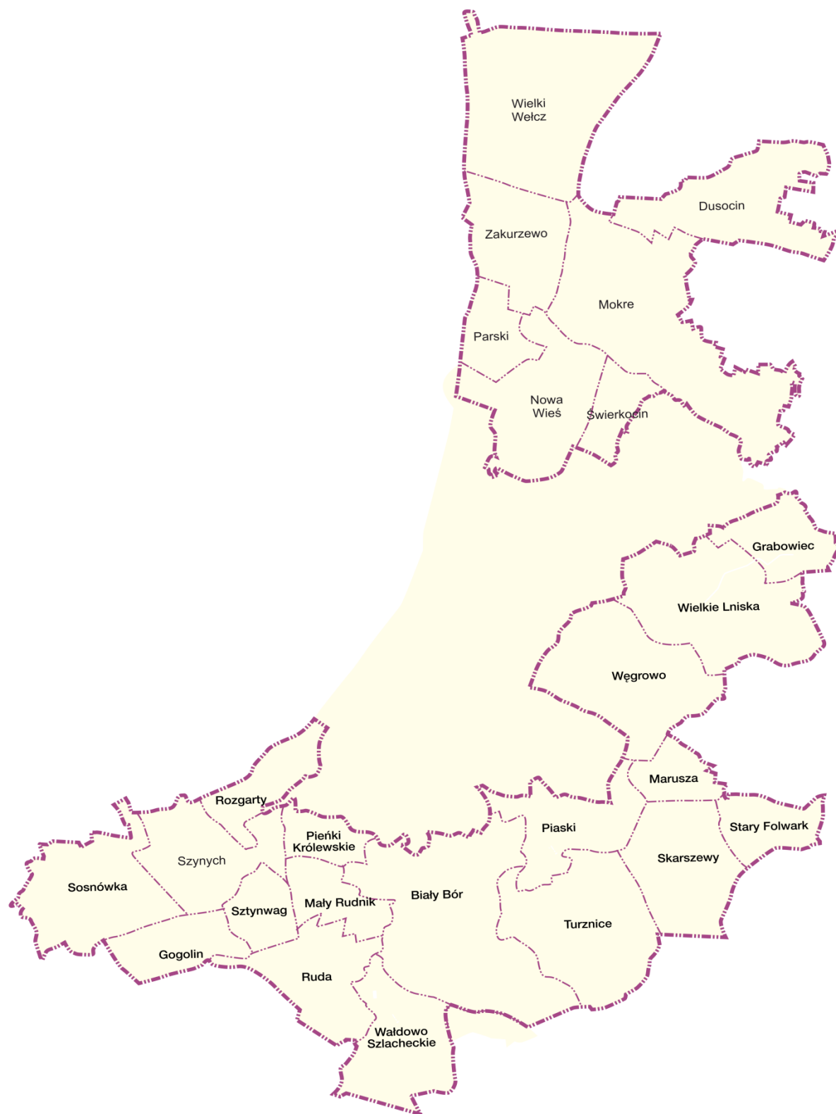
Rys. 3. Podział gminy Grudziądz na sołectwa wg stanu na dzień 31-12-2020 r.