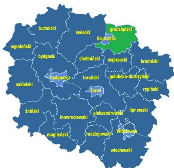
Rys. 1. Położenie powiatu grudziądzkiego w województwie Kujawsko-Pomorskim