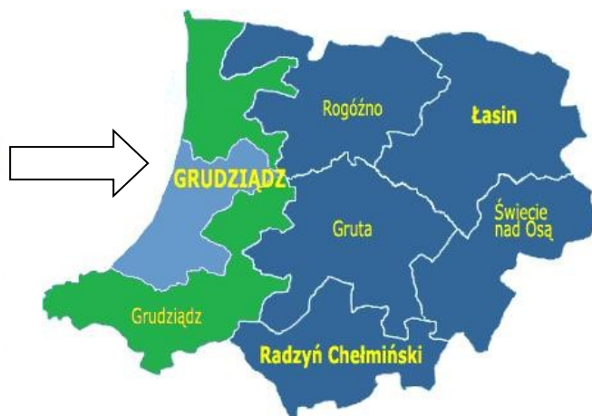
Rys. 2. Położenie Gminy Grudziądz w powiecie grudziądzkim