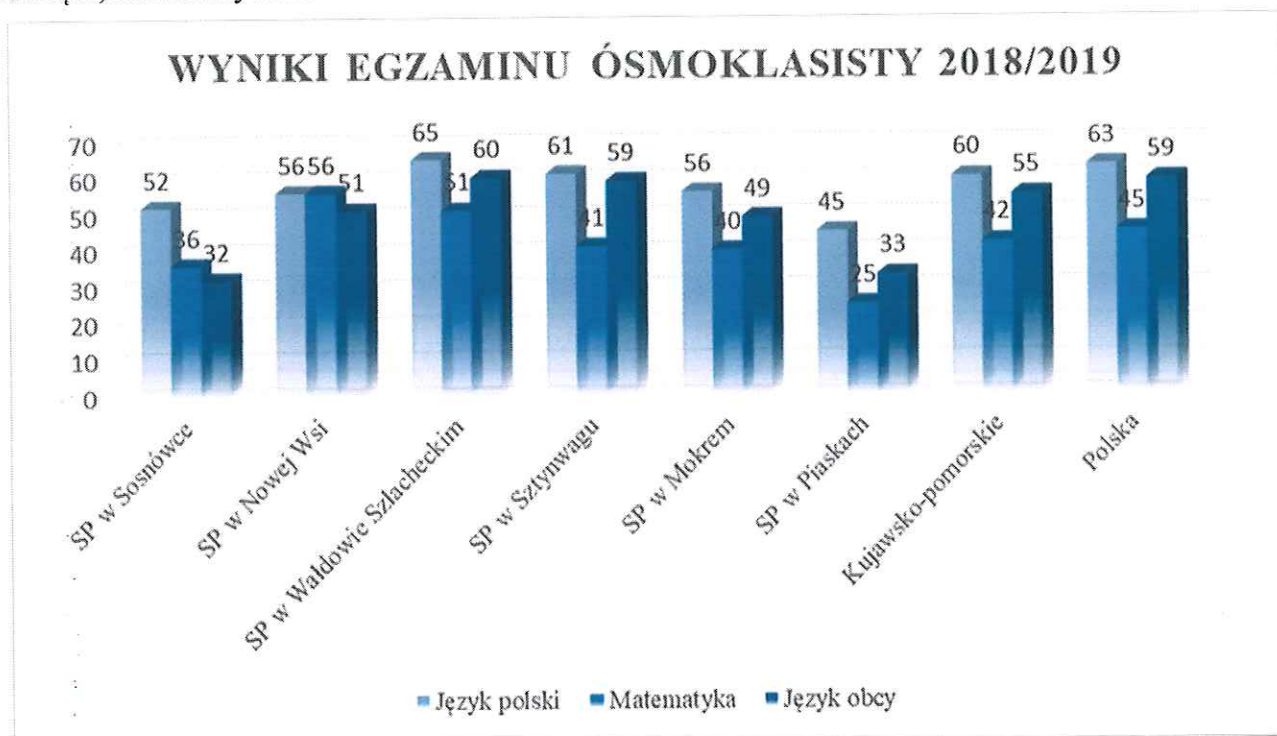
Tab. III.1 Wyniki egzaminu ósmoklasisty w szkołach, dla których organem prowadzącym jest Gmina Grudziądz, rok szkolny 2018/2019.

Dokonując analizy porównawczej pomiędzy wynikami osiągniętymi w 2019 r. w szkołach w Sosnowcu i Sztytniegu, należy zauważyć, że wyniki w tej drugiej szkole były o 27 punktów procentowych wyższe z języka angielskiego, o 5 punktów wyższe z matematyki oraz o 11 punktów procentowych wyższe z języka polskiego. Do egzaminu w roku szkolnym 2018/2019 przystąpiło: SP Sztytnieg 17 uczniów, SP Sosnowka 9 uczniów.