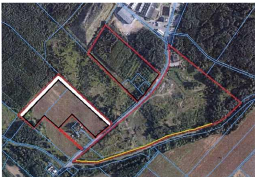
Rysunek 1 Plan nasadzeń izolacyjnych (drzewa - żółta linia, krzewy - czarna linia)