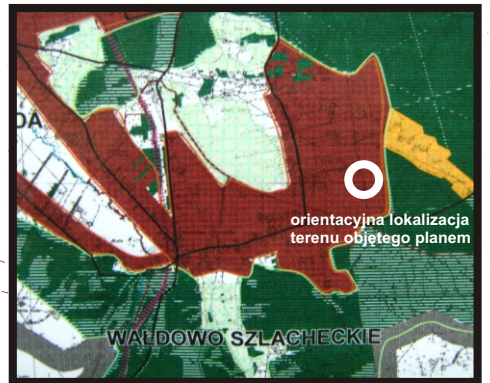
WYRYS ZE STUDIUM UWARUNKOWAŃ I KIERUNKÓW ZAGOSPODAROWANIA PRZESTRZENNEGO GMINY GRUDZIĄDZ