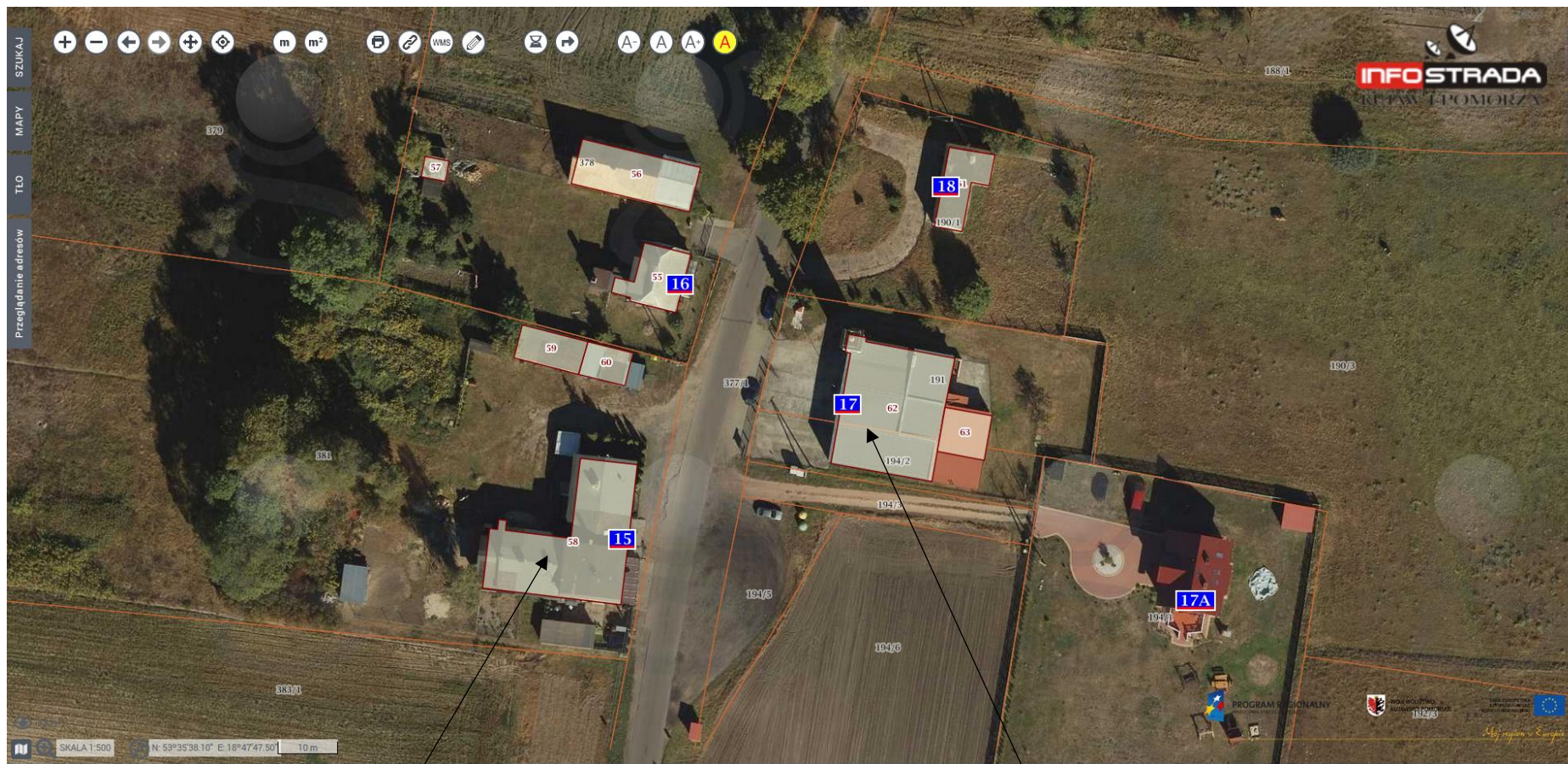
budynek wielorodzinny działka nr 381