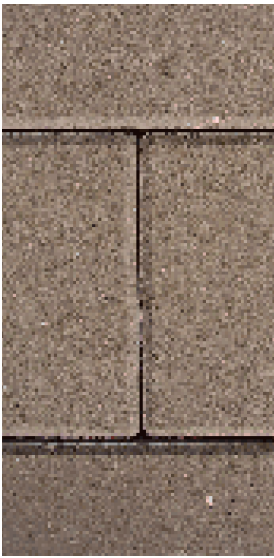
KOSTKA BET. 10X20 JASNO BRĄZOWA