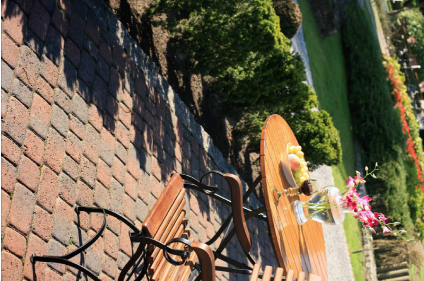
KOSTKA NA TARASY 9x12,12x12,18x12 (kolor ławo)