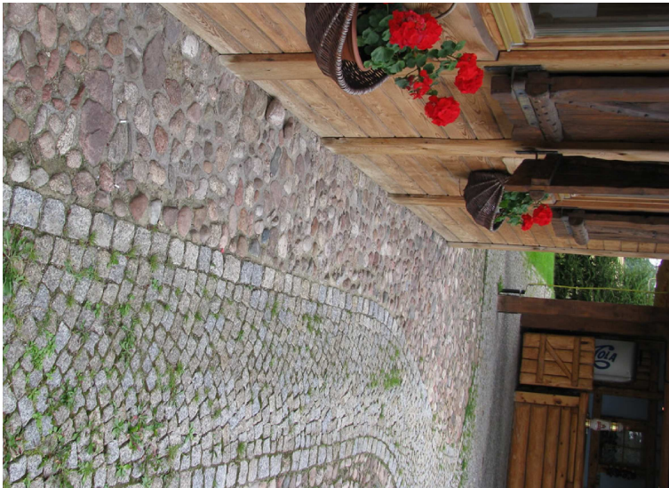
KAMIEŃ POLNY I KOSTKA GRANITOWA