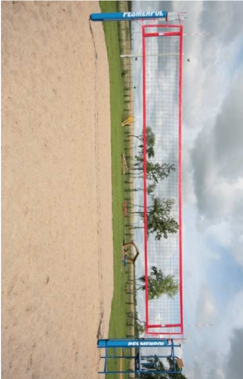
Przykładowy widok boiska do piłki siatkowej plażowej

WSZELKIE ZMIANY PROJEKTOWE UZGADNIĄC Z JEDNOSTKĄ PROJEKTOWĄ I KIEROWNIKIEM BUDOWY. ZMIANY KWALIFIKOWANE JAKO NIE ISTOTNE ODSTĄPIE OD ZATWIERDZONEGO PROJEKTU BUDOWLANEGO WYMAGAŁA RYSUNKÓW ZAMIENNYCH PRZED PRZYSTĄPIENIEM DO WYKONYWANIA PRAC