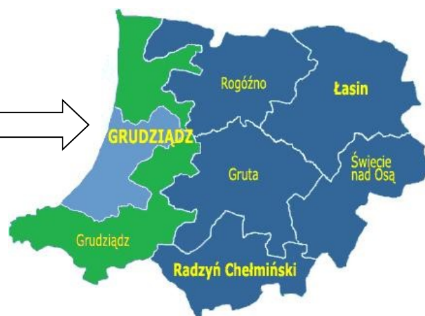
Rys. 2. Położenie Gminy Grudziądz w powiecie grudziądzkim