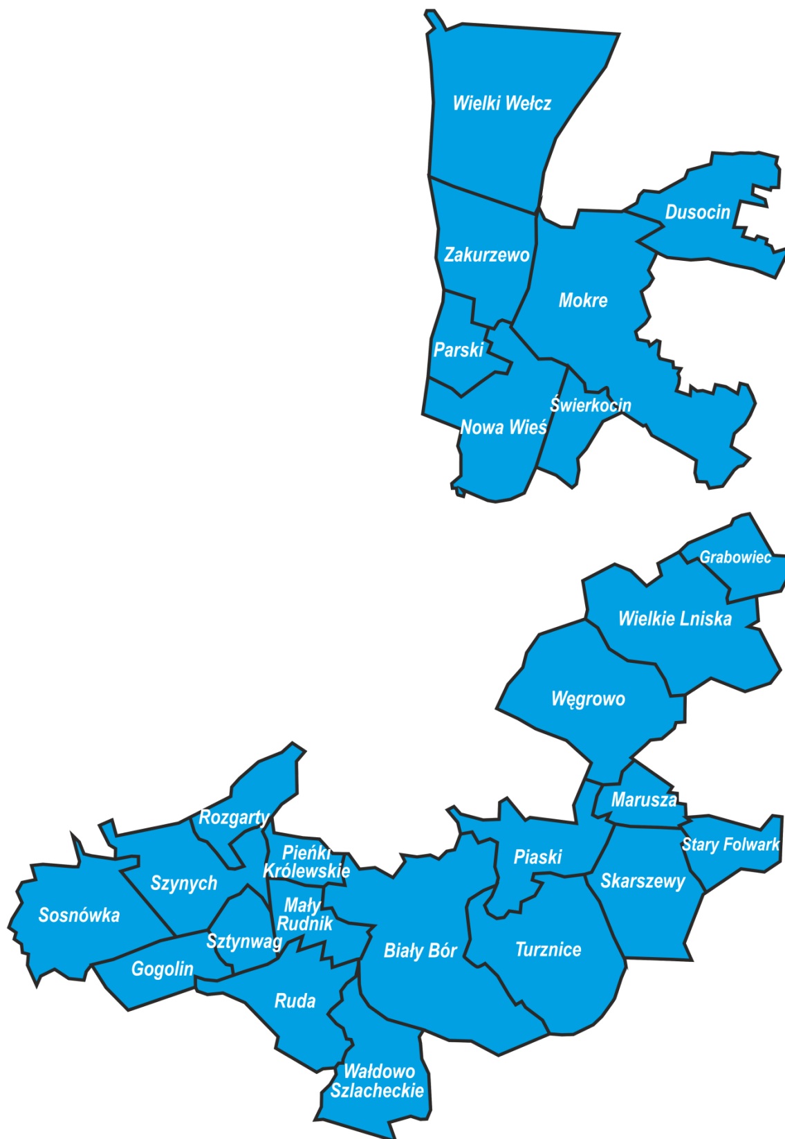
Rys. 3. Podział Gminy Grudziądz na sołectwa wg stanu na dzień 31-12-2018 r.