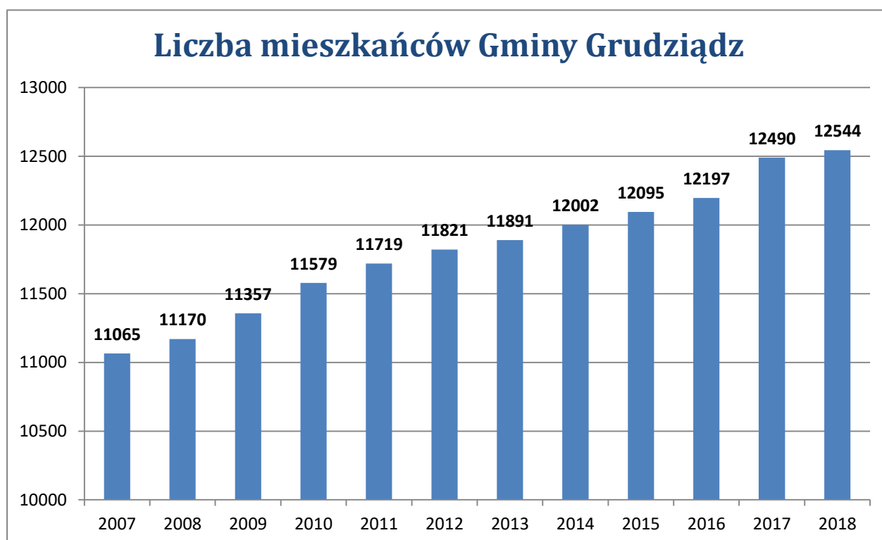
Rys. 4. Dynamika zmian liczby mieszkańców Gminy Grudziądz zameldowanych na pobyt stały i czasowy

Na dzień 31-12-2018 r. ogólna liczba mieszkańców Gminy Grudziądz, a więc zameldowanych na pobyt stały i czasowy, wynosiła 12 544 osoby. Liczba ta z roku na rok stale rośnie. W roku 2018 wzrosła o 54 osoby. Oprócz przyrostu naturalnego głównym czynnikiem wpływającym na wzrost liczby ludności jest migracja. Nowi mieszkańcy przybywają głównie z miasta Grudziądza i innych okolicznych regionów, co świadczy o atrakcyjności Gminy Grudziądz i ma duże znaczenie dla perspektyw jej dalszego rozwoju.