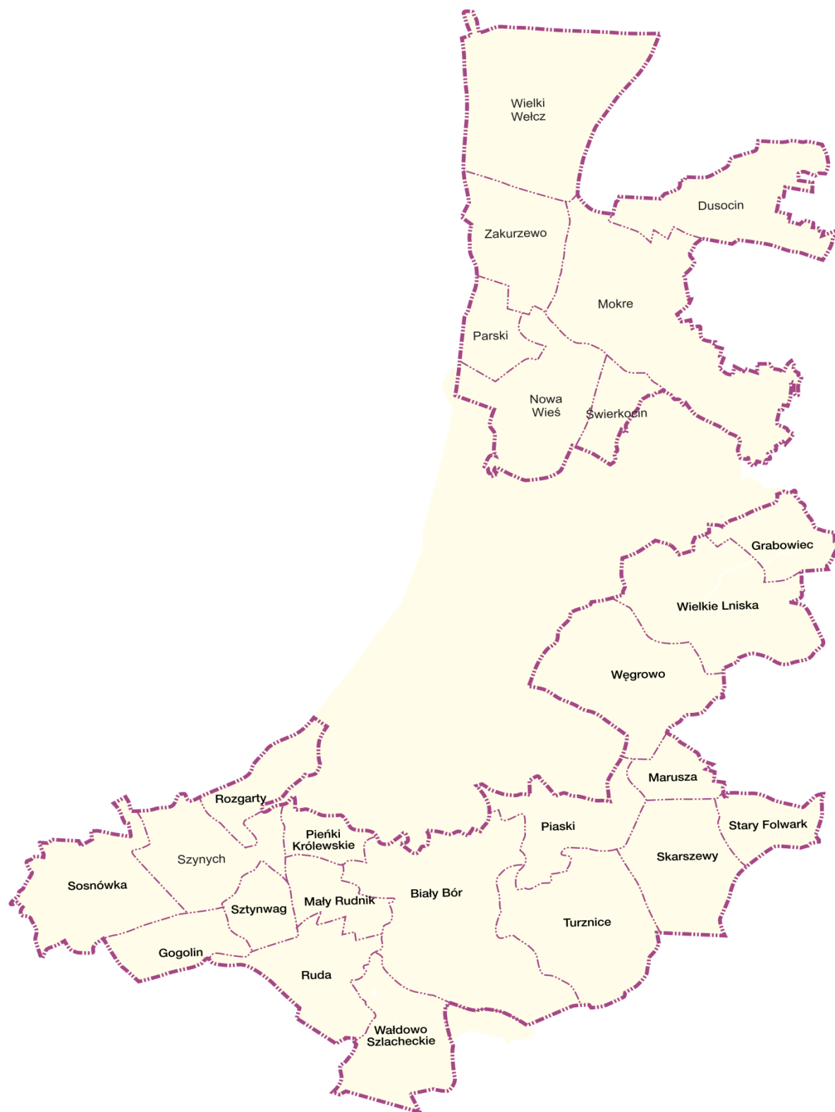
Rys. 3. Podział Gminy Grudziądz na sołectwa wg stanu na dzień 31-12-2019 r.